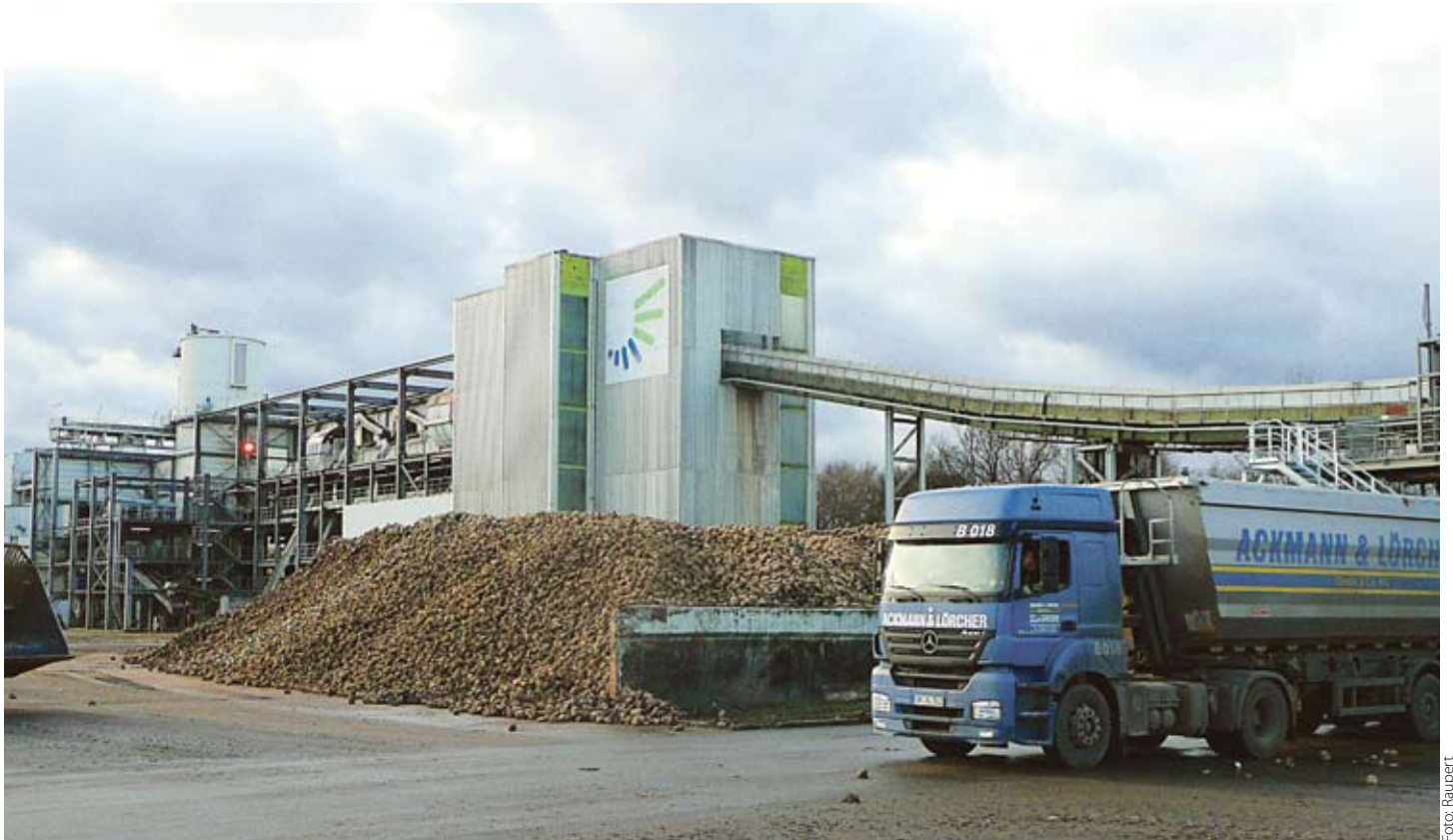
Bei den sehr guten Erlössituationen der Zuckerwirtschaft wird es Zeit, den Rohstofflieferanten wieder angemessen am Gewinn zu beteiligen. Davon sind die Unternehmen gegenwärtig aber noch einen mutigen Schritt entfernt.