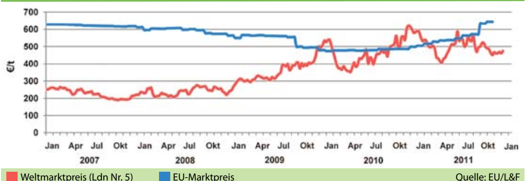
1 Entwicklung der Zuckerpreise 2007 bis 2011

frage nach Zucker nicht nur weltweit, sondern auch innerhalb der EU. Der Quotenzucker